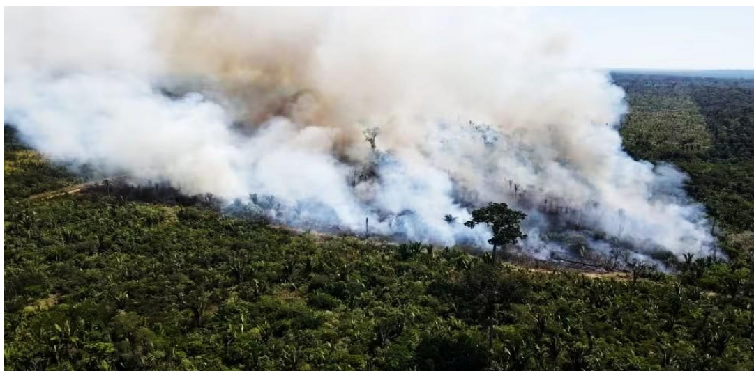
Figura 1 - Incêndio no Parque Estadual de Guajará-Mirim.

que, por sua vez, agrava as condições que favorecem a ocorrência de incêndios florestais em áreas vulneráveis, como a Amazônia.