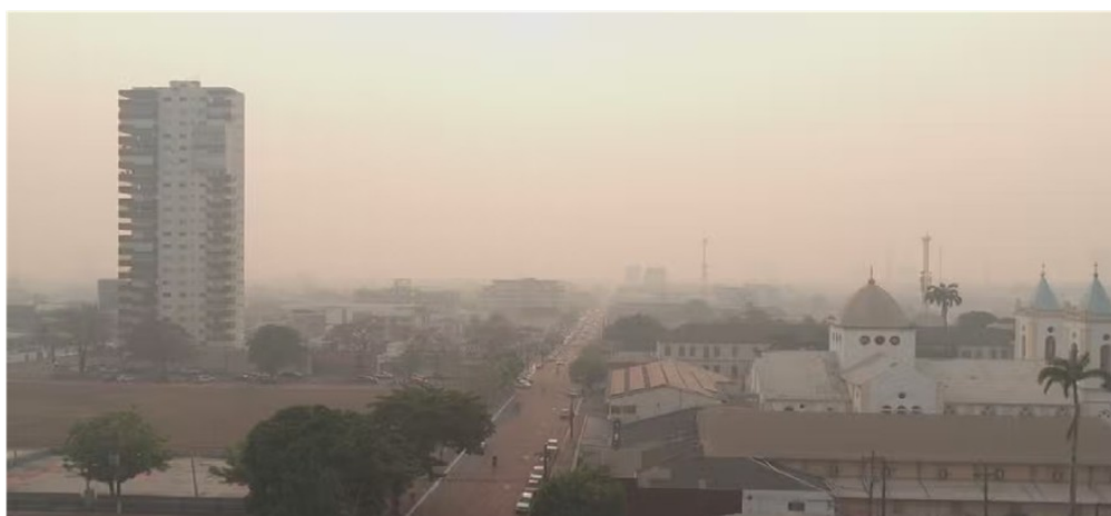
Figura 3 - Fumaça encobre céu de Porto Velho.

Conforme relatório internacional World Air Quality Report 2024, Porto Velho registrou uma média anual de 29,5 \mu\text{g}/\text{m}^3 de material particulado fino ( \text{PM}_{2.5} ), a pior qualidade do ar entre todas as cidades da América Latina naquele ano (Prefeitura de Porto Velho, 2025). Como mostra a Figura 3, entre agosto e setembro de 2024, houve dias consecutivos em que os índices de qualidade do ar na cidade foram classificados como “muito ruins” ou “perigosos” para a saúde pública.