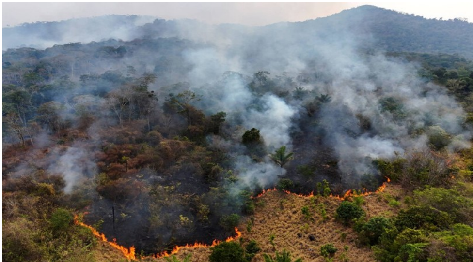
Figura 2. Queimadas em Porto Velho, Rondônia.

Outro aspecto importante a ser abordado são os impactos das queimadas na biodiversidade. A Amazônia é um dos ecossistemas mais ricos em biodiversidade do mundo, abrigando milhares de espécies de plantas e animais que dependem da floresta para sua sobrevivência. Segundo estudos da World Wide Fund for Nature (WWF), as queimadas não apenas destroem a vegetação, mas também alteram o habitat de muitas espécies, colocando em risco sua sobrevivência (WWF, 2023). Conforme mostra a Figura 2, esse processo de destruição de habitats, conhecido como fragmentação florestal, reduz a capacidade de regeneração das áreas afetadas e diminui a resiliência dos ecossistemas às mudanças climáticas.